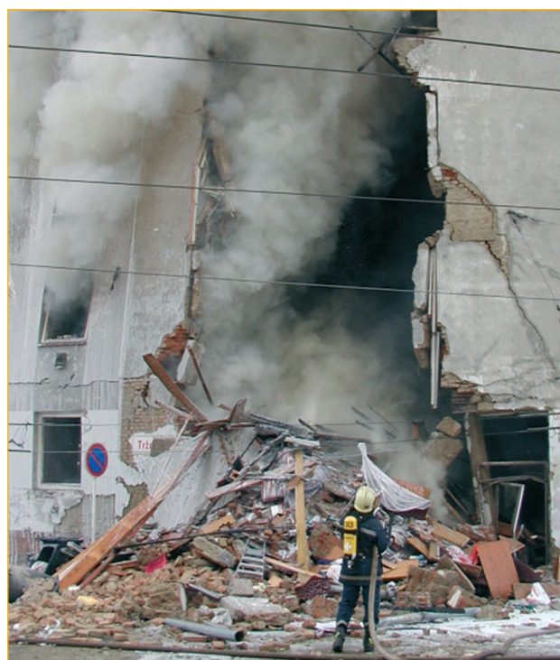
Výbuch plynu v Brně na ulici Tržní.

Jak se účinně chránit proti přítomnosti nebezpečných plynů