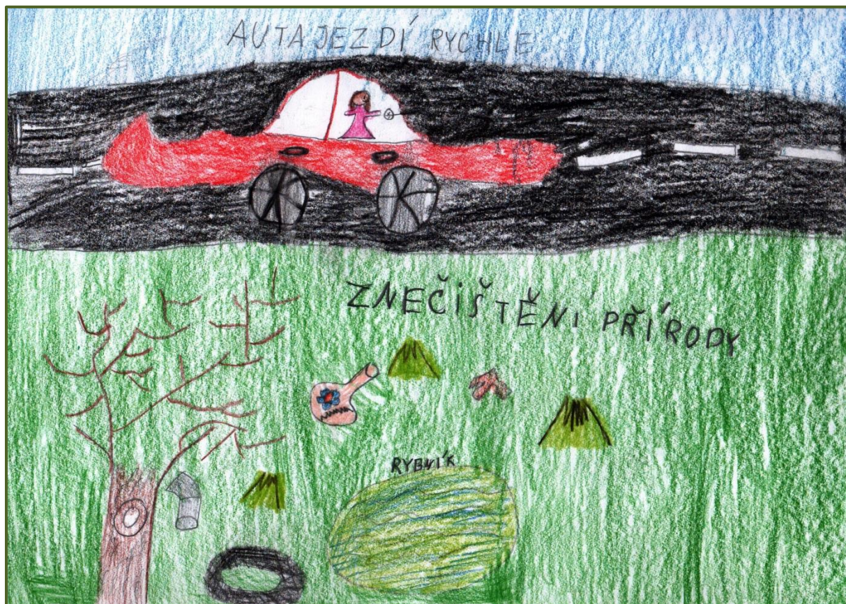
Obrázek č. 5: Markétě z Nižních Lhot vadí intenzivní doprava a znečištění přírody 10

Prioritami Nižních Lhot by podle zapojených měly být volnočasové atraktivy (nejrůznějšího druhu), hřiště, koupaliště (nebo cokoli ke koupání), maloobchod, stravování (včetně restaurací), další občanská vybavenost a silnice.