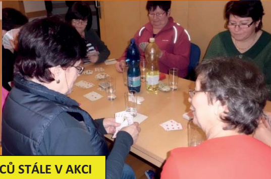
KLUB DŮCHODCŮ STÁLE V AKCI